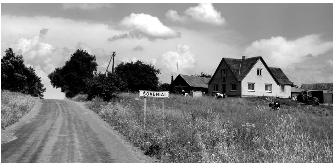
Už Budrių prasideda Šoveniai.