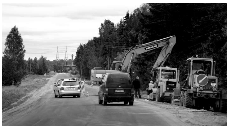
Kelyje Anykščiai-Troškūnai iki sankryžos į Andrioniškį darbai gali užtrukti iki rudens.

bėjo D. Stasiukonis. – Tvarkomi kelkraščiai, bus įrengtos perėjos, pėsčiųjų saugumo salelės, pašurkštinta granito skalda asfalto danga. Kelias, be abejonės, taps saugesnis visiems eismo dalyviams. Tačiau kol vyksta darbai, greitis šioje kelio atkarpoje ribojamas iki 50 km. per val., vairuotojams reikia būti atidiems ir atsargiems.