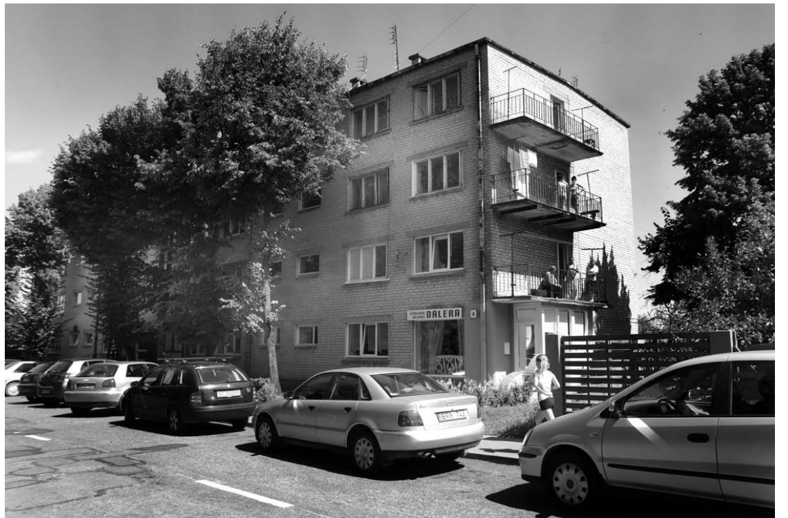
Valančiaus gatvės bendrabutis – savivaldybės pareigūnų ir jį prižiūrinčių komunalininkų galvos skausmas.