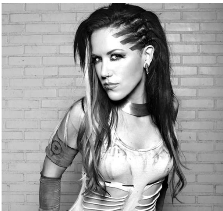
Pirmasis pasirodymas pagrindinėje scenoje vyks šią naktį. Tai bus grupė „Arch Enemy“, kurios vokalistė yra mergina.