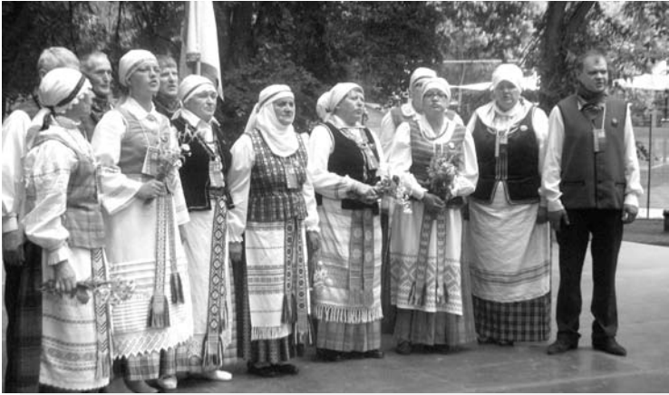
Dainomis apie gyvenimo virsmus, meilę džiugino svėdasiškiai.